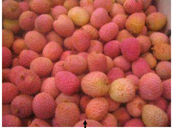
Litchis de Madagascar de qualité correcte et de coloration attractive