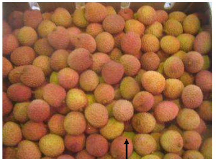
Litchis de Madagascar de qualité standard. Coloration inégale et aspect souvent terne