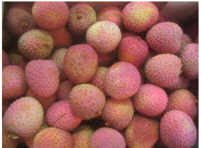
Litchis sud africains de coloration plus attractive