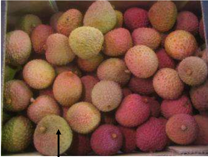
Litchis d'Afrique du Sud de gros calibre mais de coloration et aspect irrégulier