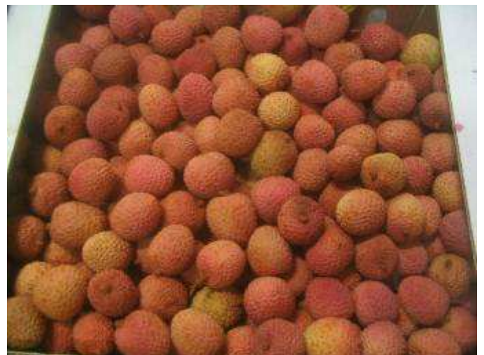
Litchis déchargés du Hansa Bremen. Qualité correcte des fruits, avec des variation de calibre et de coloration parfois marquées