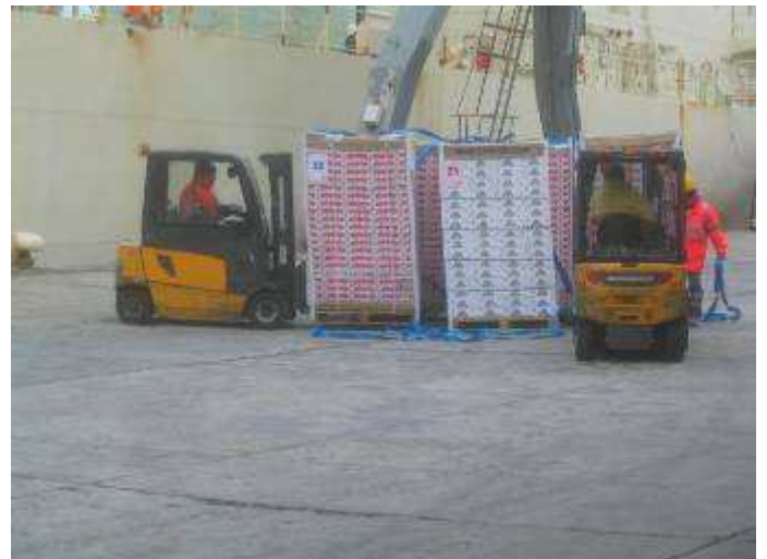
Opérations de déchargement du navire