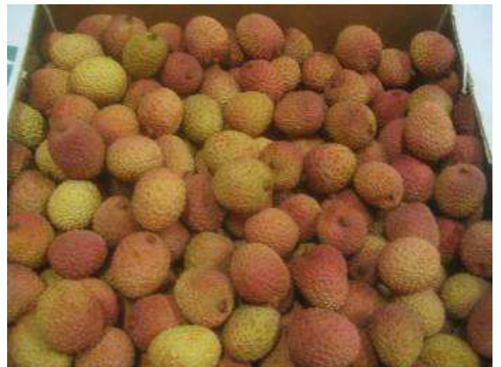
Fruits de qualité standard.