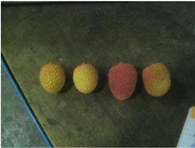
Variation de calibres et de coloration