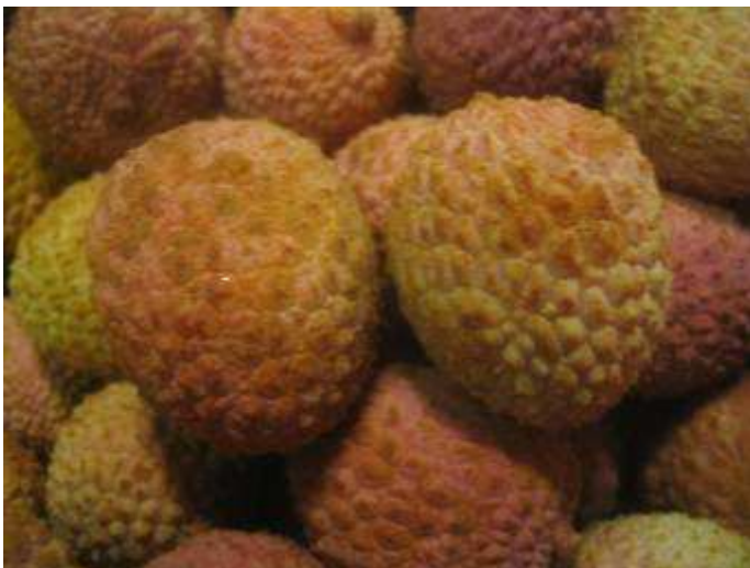
Brûlures de soufre.