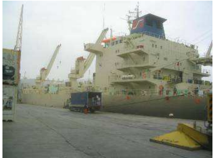
Le « Hansa Bremen » au déchargement à Gênes.