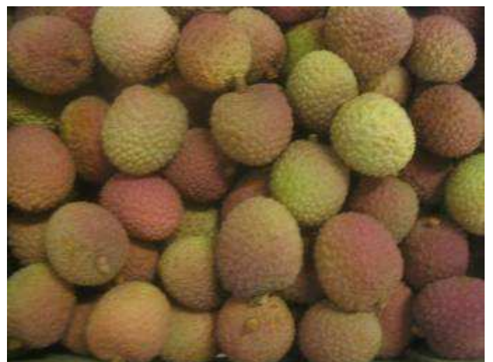
Litchis d'Afrique du Sud « bateau » de calibre XL. Coloration peu attractive