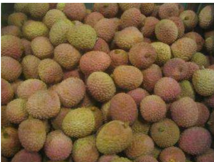
Fruits d'aspect terne