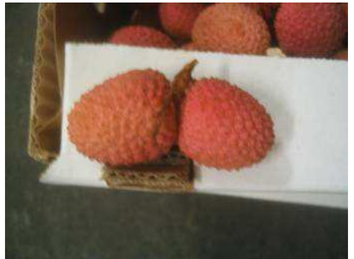
Fruits doubles avec pédoncule long.