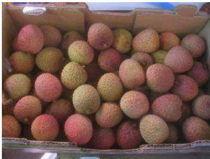
Litchis de variété Mauritius de qualité standard