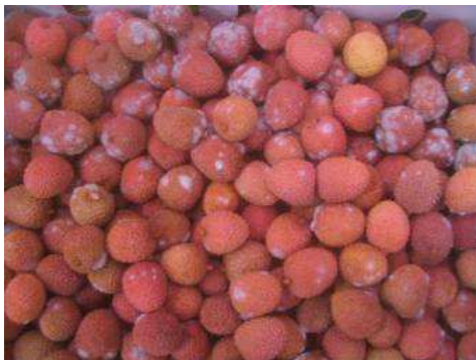
Forte attaques fongiques