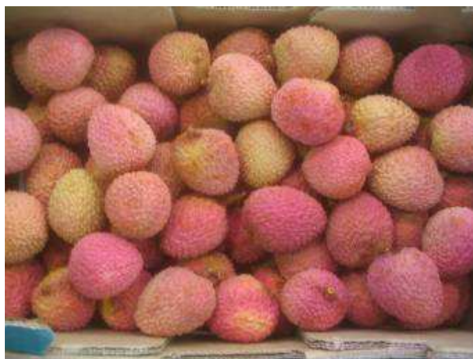
Litchis de variété Red Mc Lean de coloration inégale mais de fraîcheur correcte