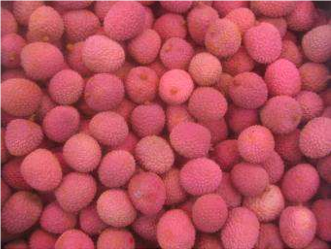
Litchis de qualité standard, de coloration assez homogène.