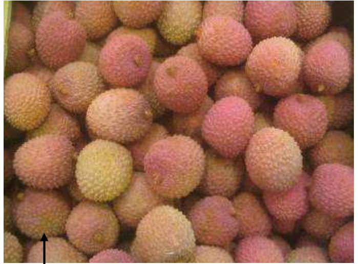
Litchis vieillissant, présentant de plus en plus de défauts (induration de la coque, décoloration, fruits écrasés etc.)