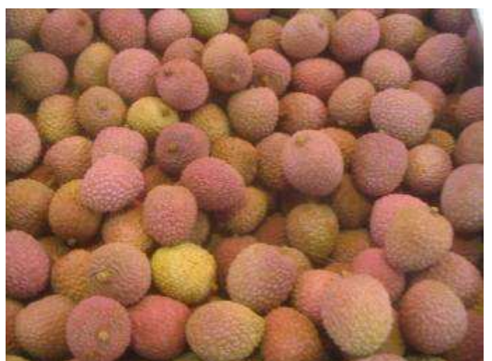
Fruits vieillissants (dessiccation de la coque, aspect terne, fruits écrasés et développement fongiques)