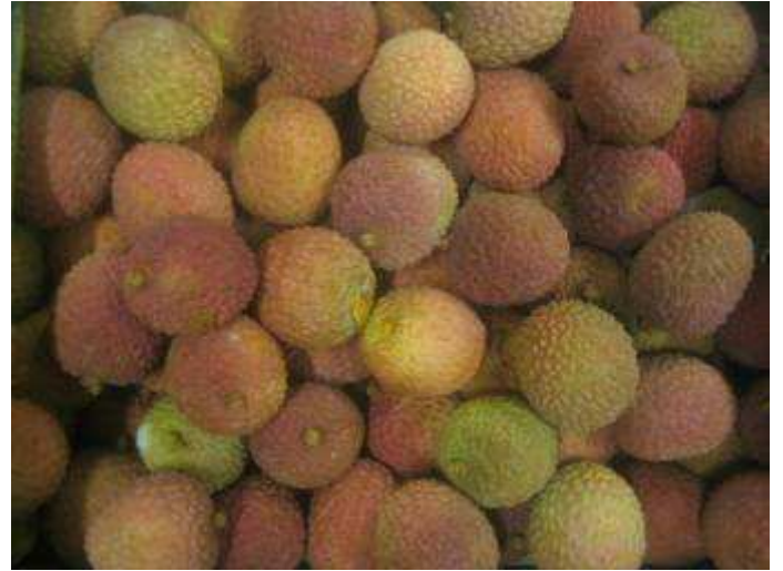
Fruits de coloration diverse. Dessiccation de la coque et développement fongique