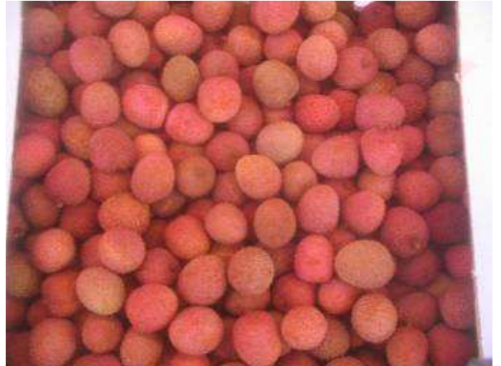
Litchis de coloration et de tenue correcte mais présentant des signes de vieillissement (induration de la coque, fruits mous etc.)