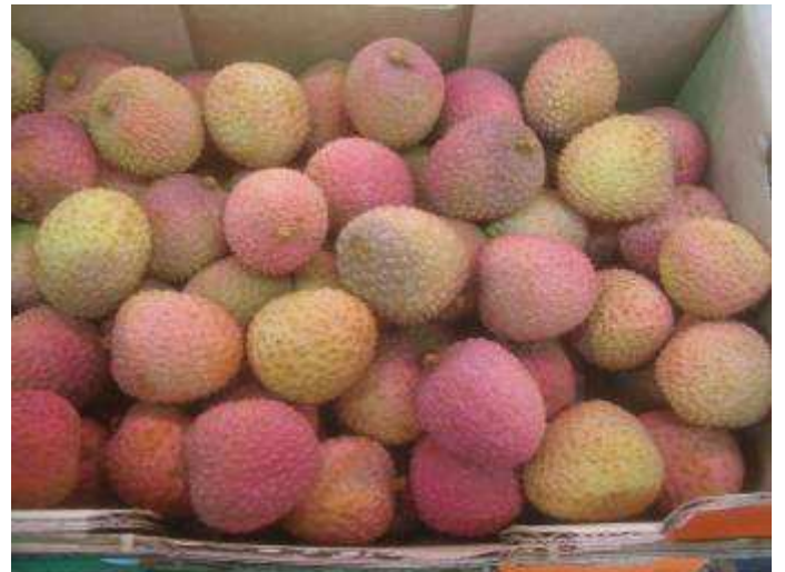
Coloration pâle. Fruits parfois tachés