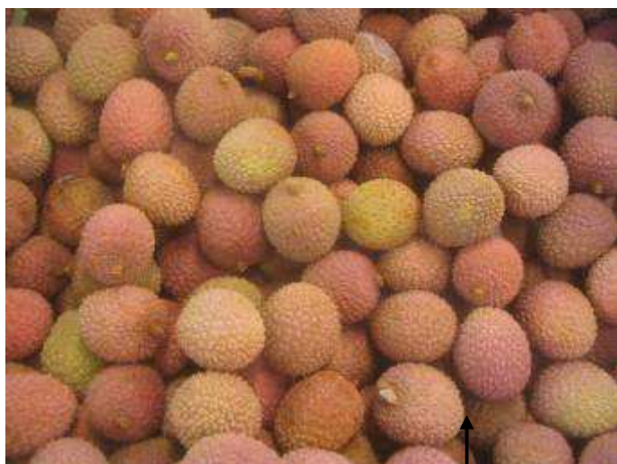
Litchis vieillissants. Aspect terne et induration progressive de la coque