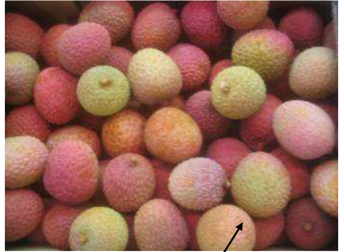
Litchis de qualité standard présentant une coloration variable. Quelques fruits mous.