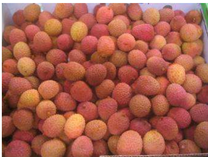
Litchis de qualité standard