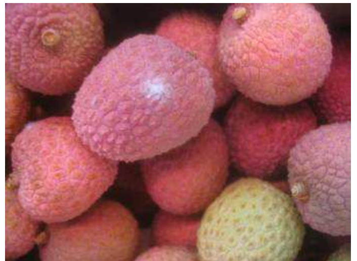
Fruits affectés de points de moisissure plus ou moins développés.