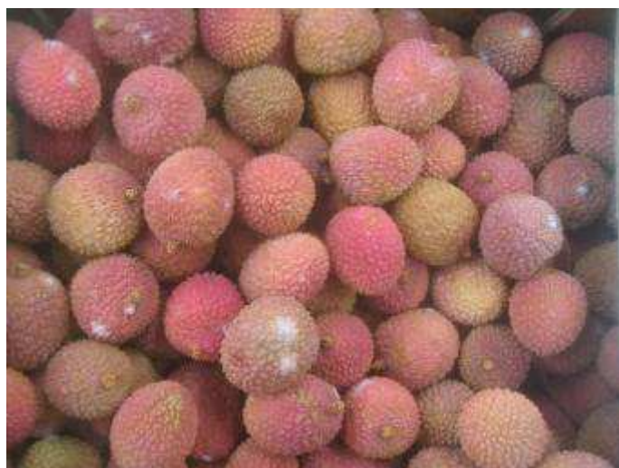
Développement de moisissures