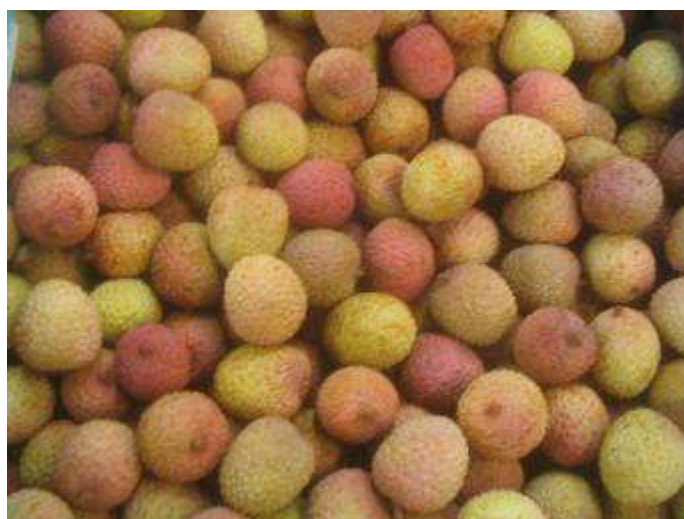
Litchis de qualité moyenne. Coloration peu attractive