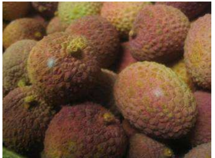
Petits points de moisissure et coloration peu attractive