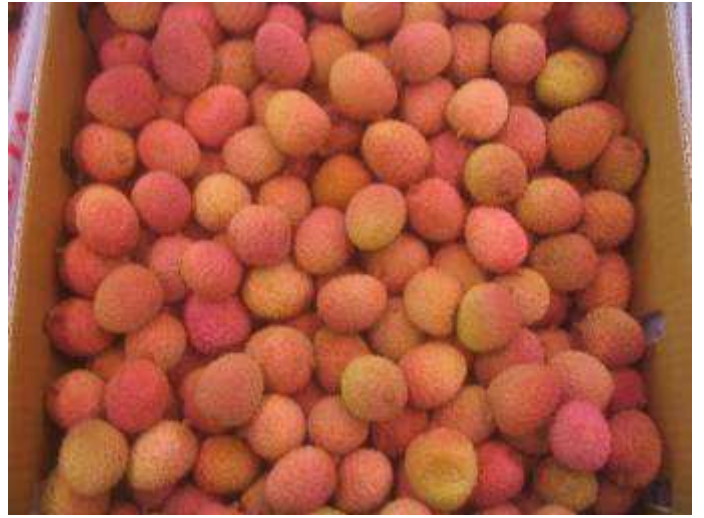
Litchis de fraîcheur et de coloration correctes