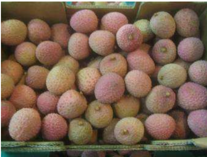
Litchis de coloration peu attractive