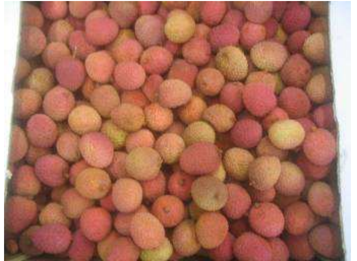
Litchis vieillissant, d'aspect terne. Induration progressive de la coque et/ou amollissement des fruits