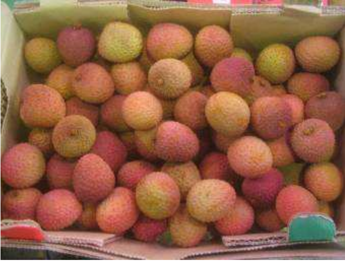
Litchis de qualité satisfaisante en terme de coloration, calibre et fraîcheur