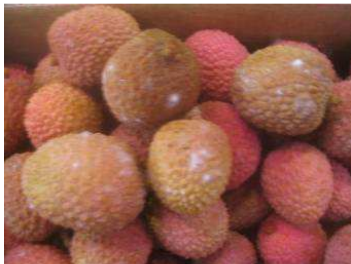
Litchis affectés de points de moisissure encore éparses.