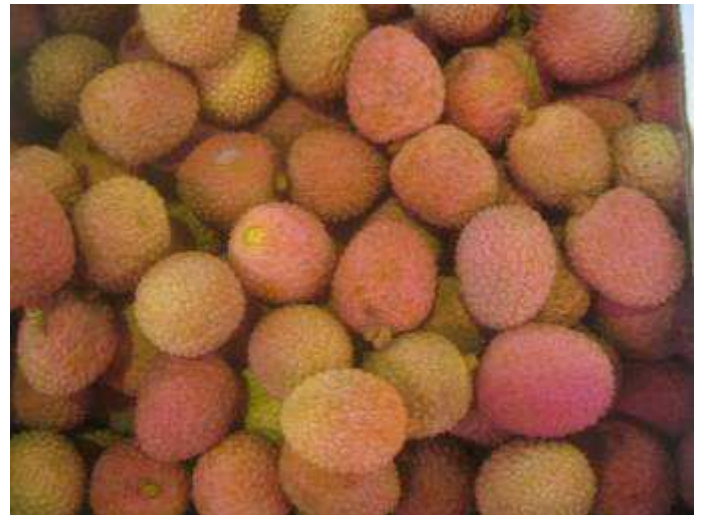
Litchis vieillissants. Aspect de plus en plus terne. Quelques fruits mous et écrasés. Coloration plus hétérogène. Induration progressive de la coque.