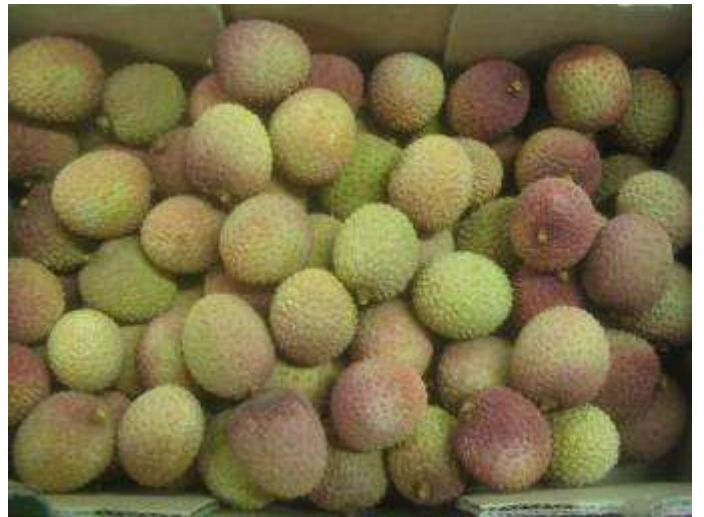
Litchis de coloration peu attractive.