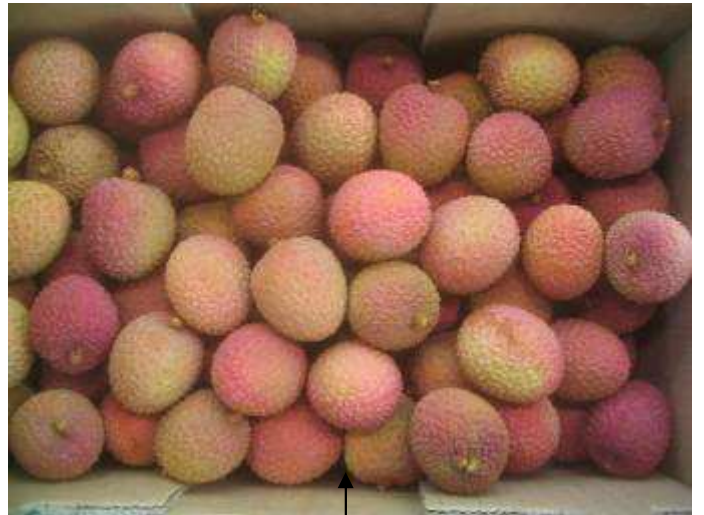
Litchis de qualité satisfaisante, coloration et calibre corrects