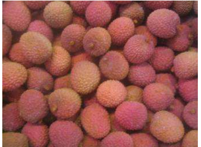
Litchis de qualité satisfaisante. Coque encore souple et coloration attractive