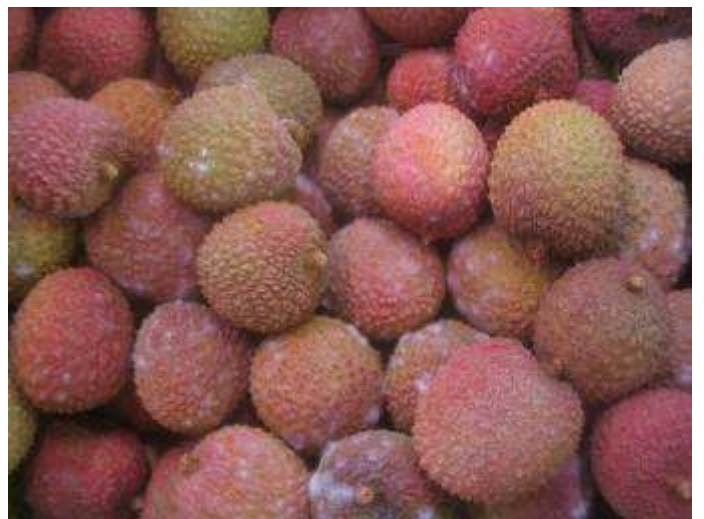
Litchis affectés de points de moisissure