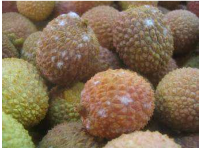
Litchis de Madagascar présentant des points de