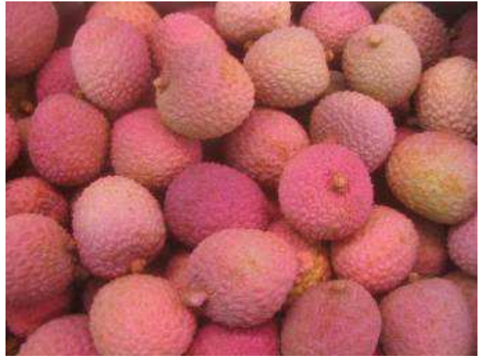
Litchis sud africain de qualité satisfaisante. Coloration satisfaisante. Bonne qualité gustative.