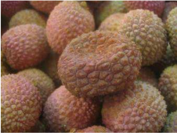
Litchis de Madagascar vieillissants. Fruits écrasés