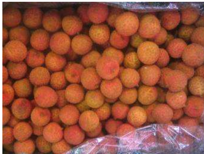
Litchis frais égrenés d'Australie