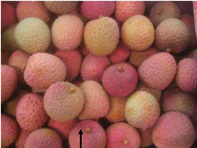
Litchis d'Afrique du Sud de coloration inégale, présentant quelques brûlures de soufre et quelques fruits écrasés