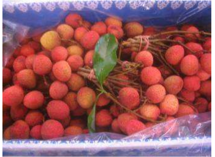
Litchis frais de la Réunion branchés ou présentés en bouquet.