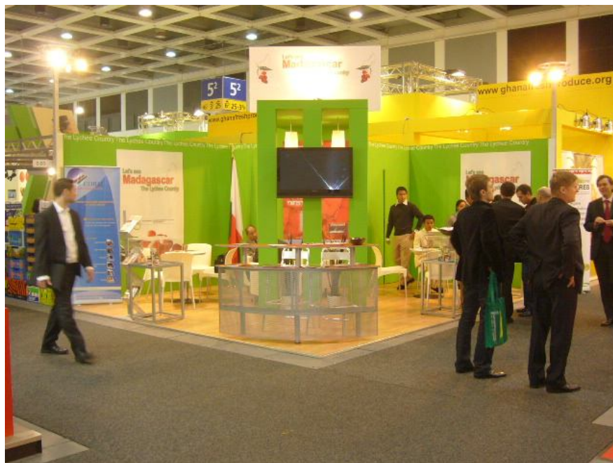
Stand de Madagascar à la Fruit Logistica de Berlin