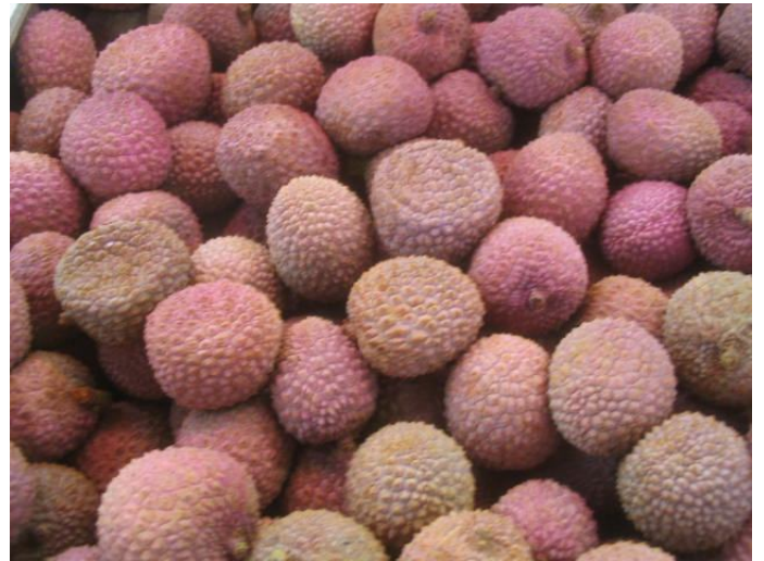
Litchis de Madagascar. Colis de bas de palette présentant des fruits écrasés