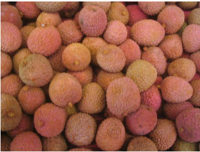
Litchis de Madagascar vieillissant. Fruits « soufflés », mous, oxydés.