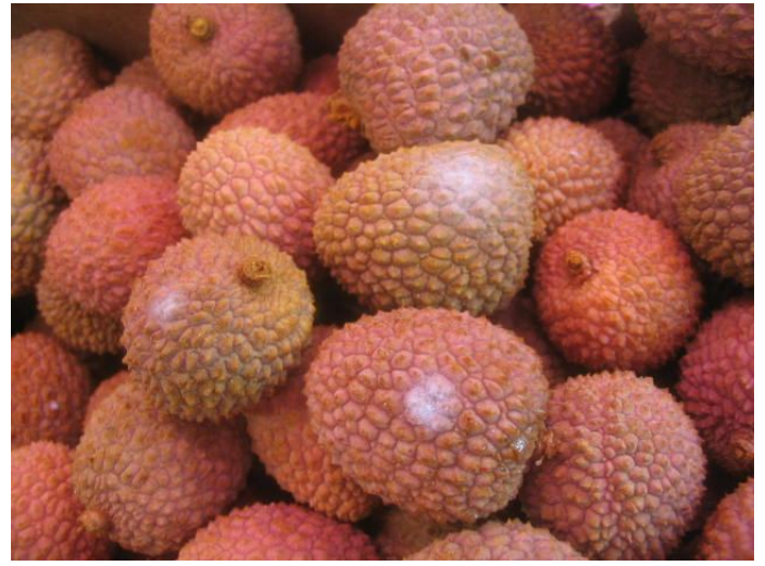
Litchis de Madagascar. Détail de développement de moisissures