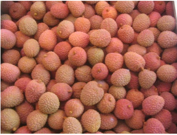
Litchis de Madagascar de qualité moyenne avec quelques développements de moisissures