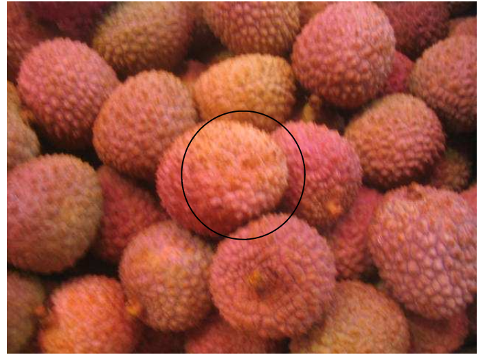
Litchis de Madagascar. Fruits « soufflés »