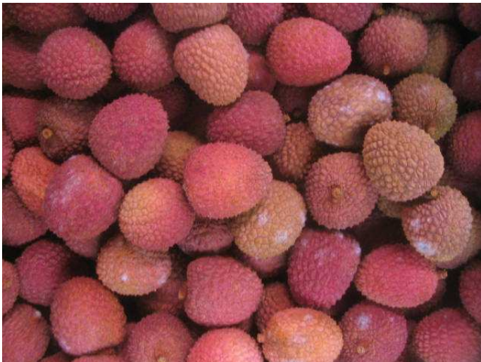
Litchis de Madagascar. Attaques de moisissures importantes.