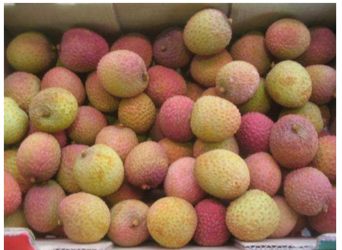
Litchis d'Afrique du Sud de qualité satisfaisante. Coloration hétérogène