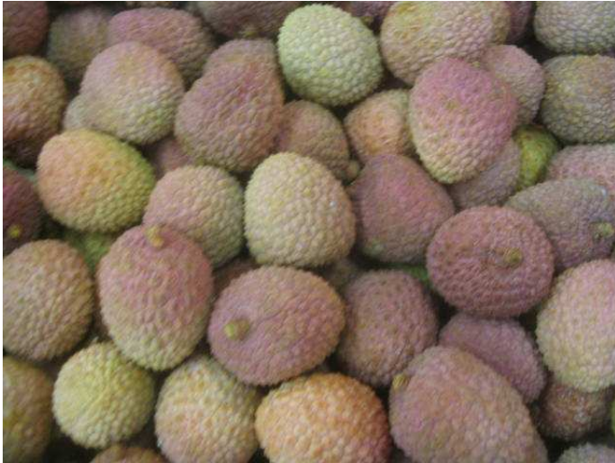
Litchis de Madagascar vieillissant. Induration progressive de la coque