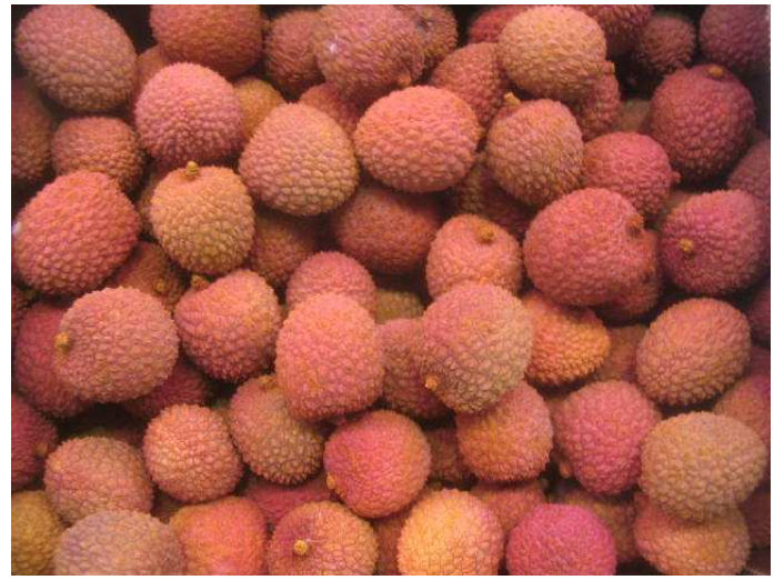
Litchis de Madagascar de qualité standard. Coloration uniforme, calibre hétérogène, fraîcheur correcte