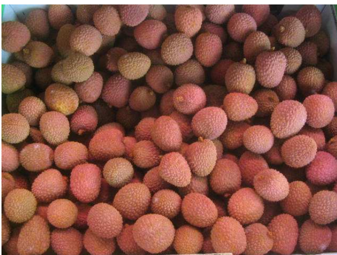
Litchis de Madagascar en phase de dessiccation