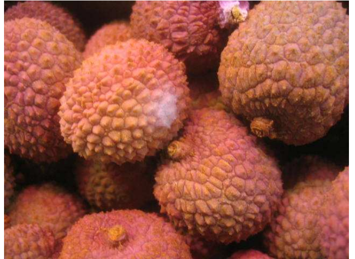
Litchis de Madagascar. Apparition de points de moisissure