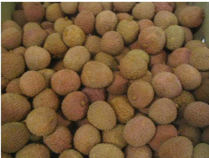
Litchis de Madagascar d'aspect terne et défraîchis