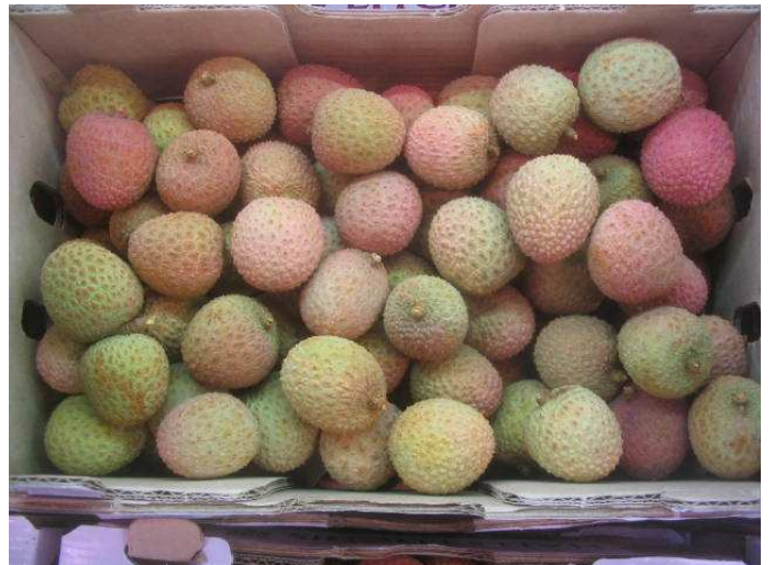
Litchis d'Afrique du Sud de coloration peu attractive