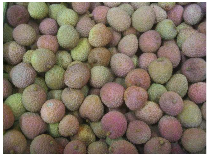
Litchis de Madagascar vieillissant, de coloration peu attractive